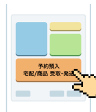
④マルチエキュープで予約番号を入力or QRコードを読み取る