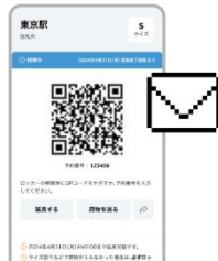
③利用日の朝、予約番号とQRコードが発行される