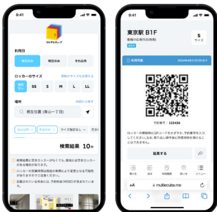
マルチキューブ WEB サイトイメージ