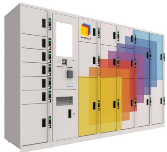
マルチエキュープ外観(イメージ)

2024 年 7 月末日現在、東京駅や新宿駅などに計 216 台を設置しています。2026 年度までに首都圏駅構内を中心に、約 1,000 台を展開予定です。