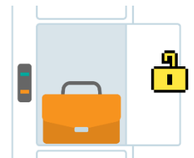
⑤開いた扉に荷物を預け入れる