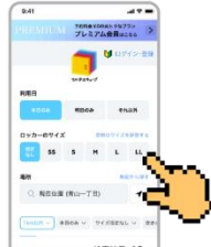
②利用するマルチエキュープを検索