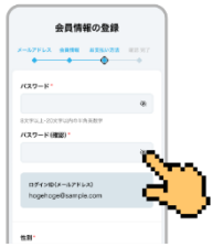
①サイト上で会員登録